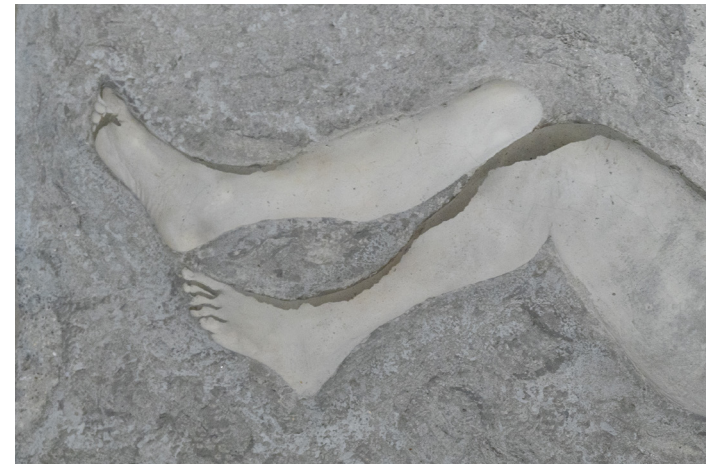
From Fossil series, 2022 Beton | Concrete, 50 × 195 × 80 cm